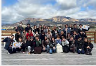
あそ望の郷くぎの