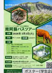
ポスター(学生企画委員作成)