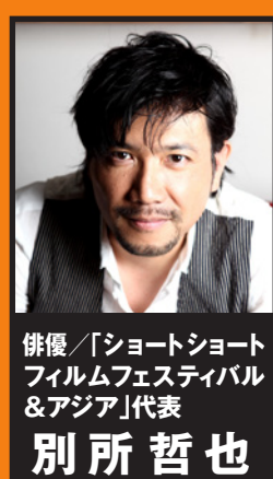
俳優/「ショートショート フィルムフェスティバル & アジア」代表 別所 哲也